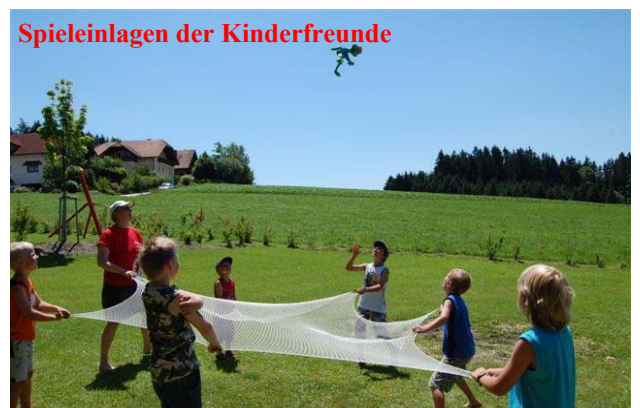
Spieleinlagen der Kinderfreunde