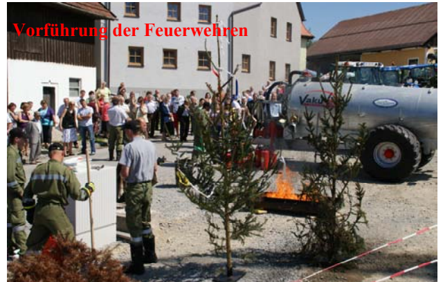
Vorführung der Feuerwehren